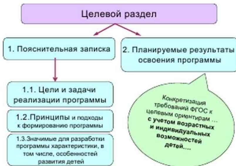
Схема 1. Структура целевого раздела Программы.

Начинать проектирование целевого раздела основной образовательной программы дошкольного образования целесообразно «с конца» — с уточнения планируемых результатов ее освоения ребенком , установления их соответствия Федеральному государственному образовательному стандарту. Ориентиром для разработчиков программы являются планируемые результаты освоения Программы, представленные в ФГОС и в тексте примерной программы.